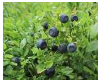
brusnice borůvka dobrá a zdravá