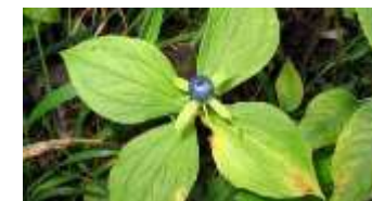
vraní oko čtyřlísté prudce jedovaté, nejíst!